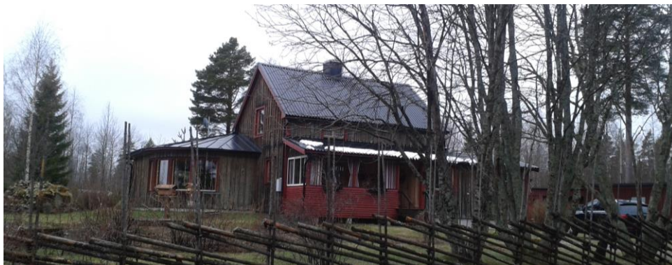
Befintlig bebyggelse inom bestämmeområdet