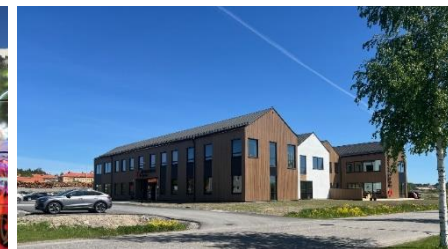
Östernäs idag: Grönområde, park och Byggfaktas huvudkontor, foto privat.